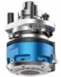
FLOATING V C Tastaggregat vertikal