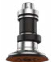
SIMOLO Exzentrerschleifaggregat für ebene Flächen, konvexe und konkave Flächen