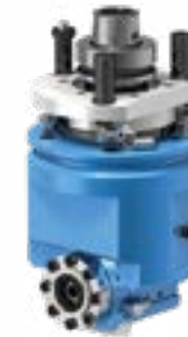
1 FLOATING H Tenso Tastaggregat horizontal für vertikale Nuten für Verbinder Tenso P-14