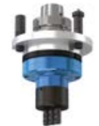
2 MULTI V3 Cabineo Mehrschindelkopf vertikal für Verbindertaschen für Verbinder Cabineo