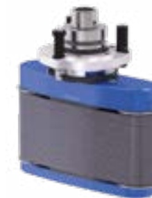
COLLEVO + Bandschleifaggregat für ebene Flächen, Außen- und Innenrundungen