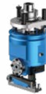
FLOATING H S Tastaggregat horizontal